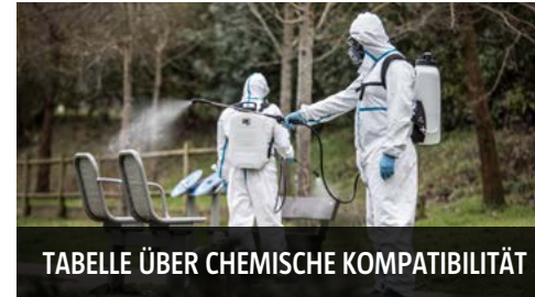
TABELLE ÜBER CHEMISCHE KOMPATIBILITÄT