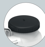
Amplia boca de llenado con filtro