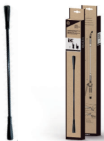
TUBO DE FIBRA DE VIDRIO CON TUERCAS DE 47 CM cod. 8.26.71.873

Maneta versátil y adaptable a cada aplicación.