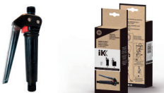
MANETA IK (INOX) cod. 8.26.71.872

Manguera de diámetro 12mm. Aporta facilidad de movimiento y resistencia química.