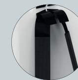
Correas acolchadas y regulables