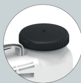
Tapa depósito con válvula antigoteo