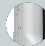
Depósito translúcido con indicador de nivel