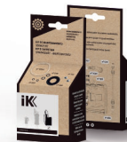
JUEGO DE BOQUILLAS PARA PULVERIZADORIK MULTI 6-9-12, 12BS / PRO 9-12 cod. 8.26.71.871