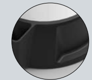
Base stable avec appui pour les pieds