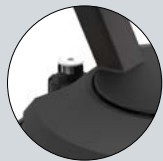
Soupape de sécurité dépressurisable