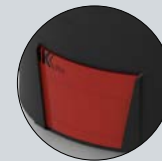
Indicateur de contenu