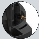
Possibilité d'obtenir 3 types de mousse