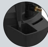
Système de fixation du gonfleur pendant le remplissage