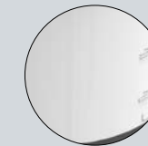
Réservoir translucide avec indicateur de niveau