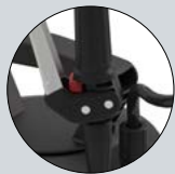
Verrouillage de sécurité