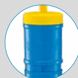
Actionnement ergonomique facile à utiliser